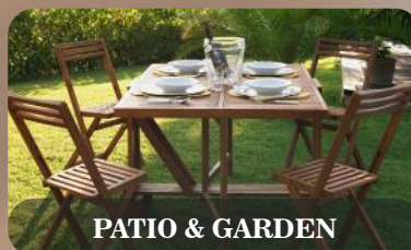
PATIO & GARDEN